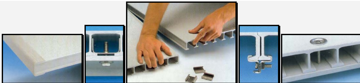
ZDJĘCIA 3 – panel pomostowy, przykłady łączenia